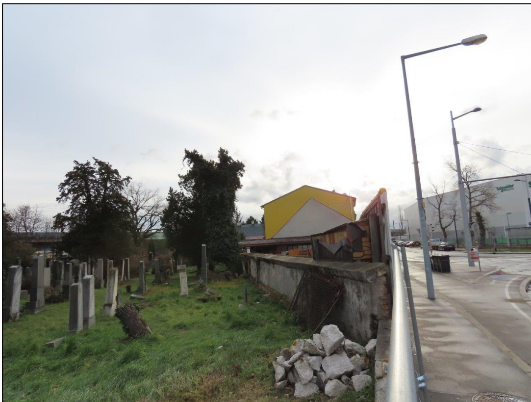
Der jüdische Friedhof in der Ruthnergasse und die Stelle, an der sich einst das Haus Nr. 24 befand.